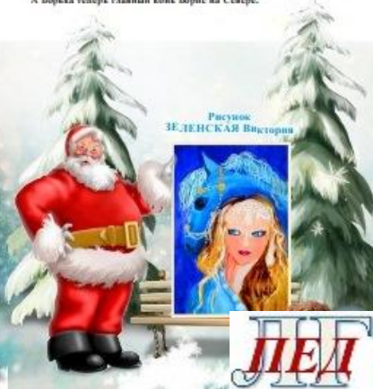
Рисунок ЗЕЛЕНСКОЙ Викторией

– Такой необычный. Я его возьму к себе. Он мне поможет будет. А работа у меня очень важная, она касается всех жителей в мире. А хочется ли ты со мной поехать вместе с Борькой? Будешь жить у меня, как Сингурочка.